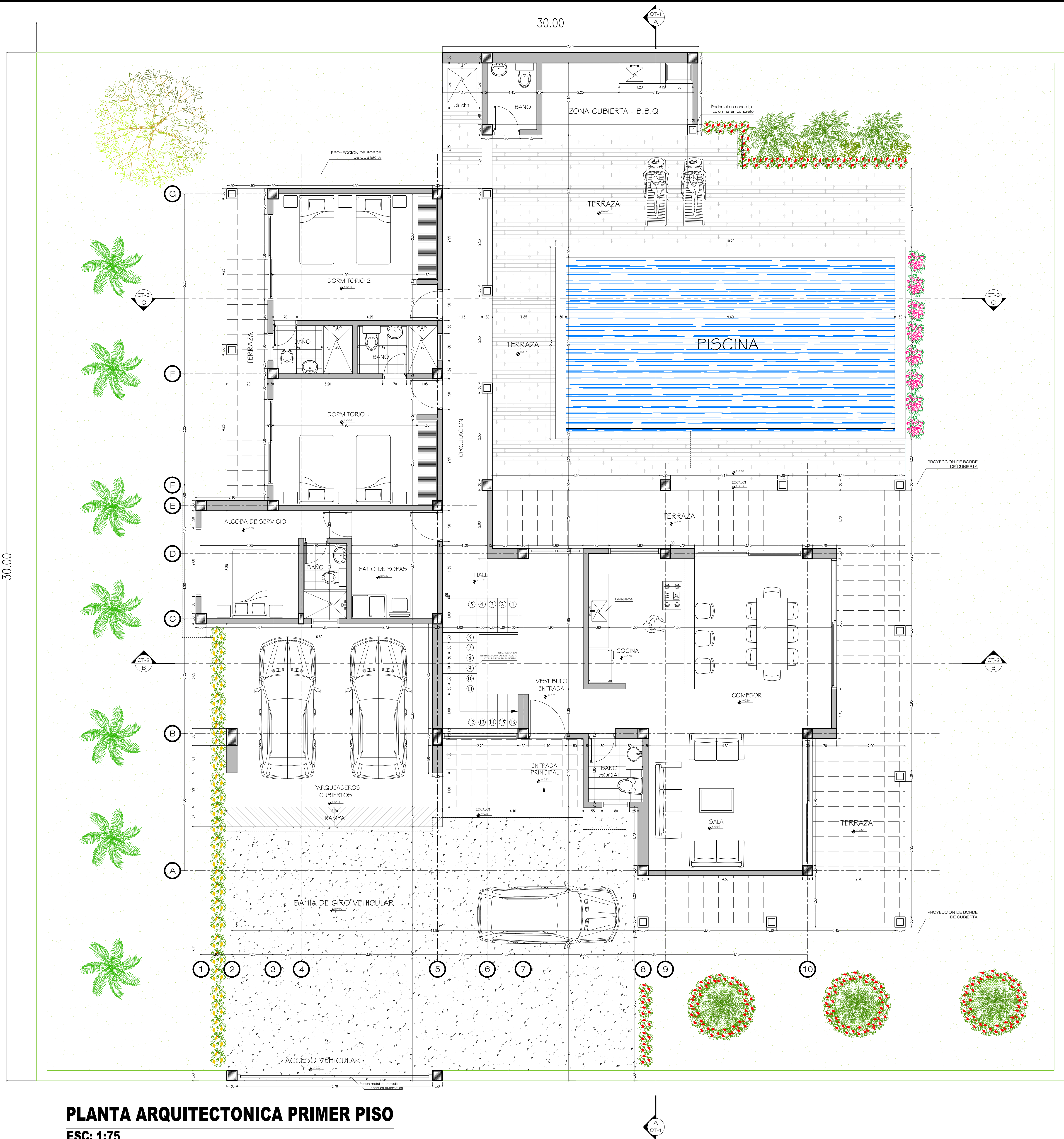
PLANTA ARQUITECTONICA PRIMER PISO ESC: 1:75