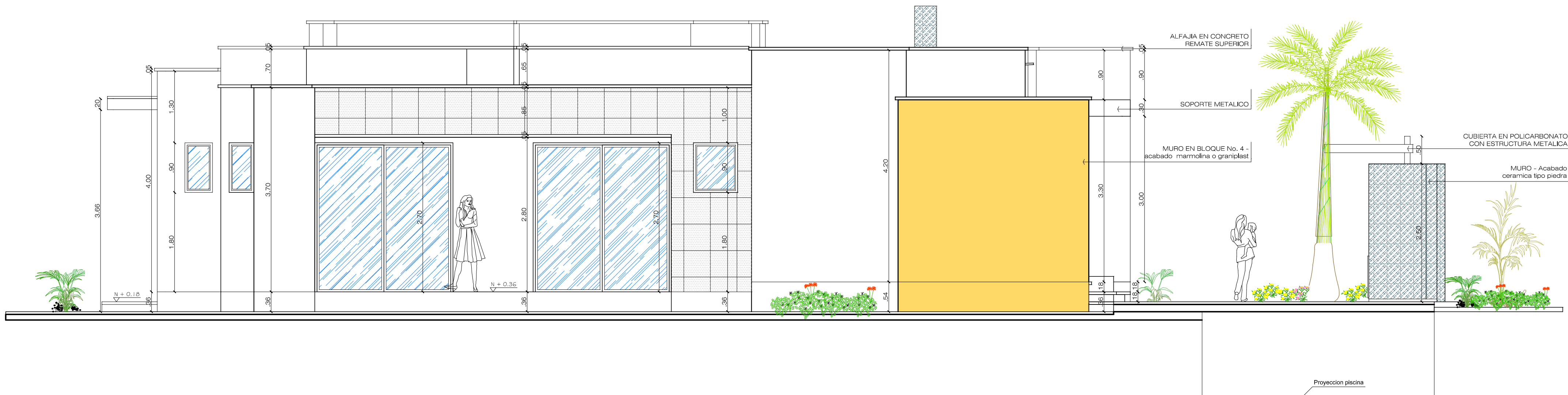
FACHADA POSTERIOR ESC: 1:50